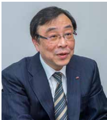
阿自倍尔株式会社 取缔役兼执行役員常务 先进工业自动化公司社长

该事业领域从大型装置(石油、化学、钢铁等)到工厂(电子电气、半导体、汽车、食品、医药品等)、社会基础设施(电力/燃气、净水厂、