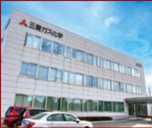
三菱ガス化学株式会社 水島工場

キシレン誘導体をはじめ広範な化学製品を製造する三菱ガス化学の水島工場では、プラントの安定操業を実現するにあたり運転管理のあるべき姿を検討。施策の一環として、製造設備における異常の発生を予兆の段階で捕捉できる検知システムを整備しました。問題が顕在化する前に、余裕を持って、運転員が必要な対応を行うことができる体制の実現で、操業の安定性が向上し、運転員の負荷も大幅に削減されています。