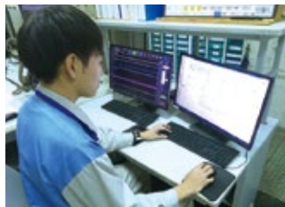
BiG EYESのトレンド監視ビューア(左)とコンフィギュレータ(設定)画面(右)。監視対象に関連するポイントを登録し監視モデルを作成する。他社DCSとオンラインで接続し監視を行う。